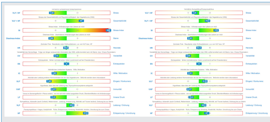
Abb. 2: Regulation aus Fallbeispiel 2. Erste Messung 17:30 Uhr (links), zweite Messung 17:40 Uhr (rechts)

inneren Raum von Frieden und Stille, der sich entlastend auf das vegetative Regulationssystem auswirkt.